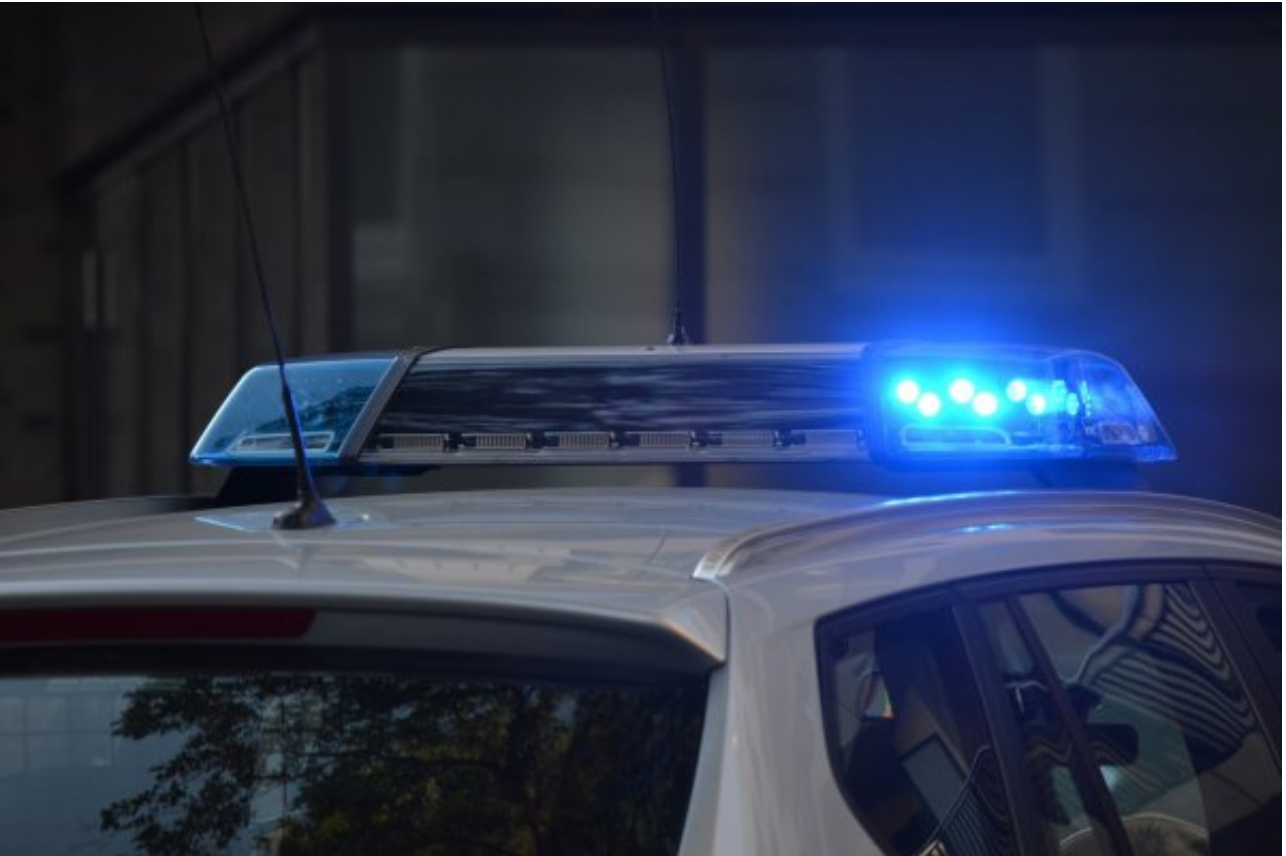
Die Polizei im Einsatz.